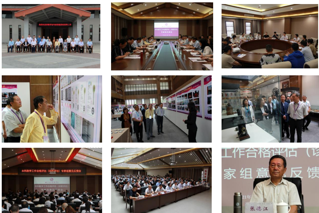
组图 2 本科教学工作诊断性评估

三天的时间里，各位专家在听取校长报告、审读学校自评报告和教学状态数据分析报告的基础上，深入学校各部门、各二级学院，通过查阅资料、深入课堂听课、检查毕业设计（论文）和试卷、走访学校领导及部门、考察办学条件、召开座谈会等形式，全面诊断我校本科教学工作的状态，客观指出了学校在本科教学工作中存在的问题和不足，并提出了建设性地意见和建议。