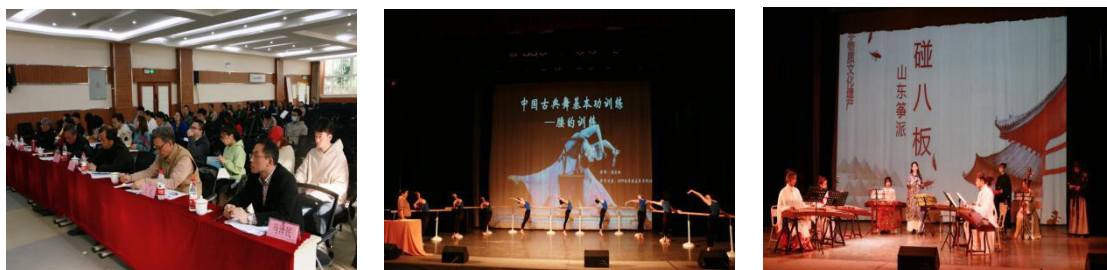
组图 4 2020 年教师教学技能大赛决赛

长杨文勇出席。决赛现场，参赛老师们准确把握教学内容和节奏，多维度地演绎了课堂教学艺术，高水准地展示出了我校教师的课堂教学水平。