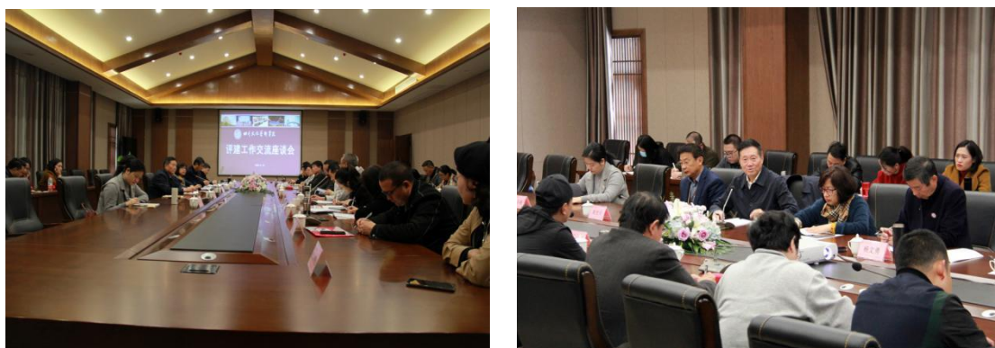
组图3 评建工作交流座谈会

四、11月13日，评建工作交流座谈会在梓潼校区文昌学宫四号会议室召开。教育部本科教学评估专家张德江教授、学校校级领导，各职能部门、二级学院负责人围绕评建工作，对立德树人、应用型人才培养、师资队伍建设、学风建设等方面工作展开了深入探讨和交流。