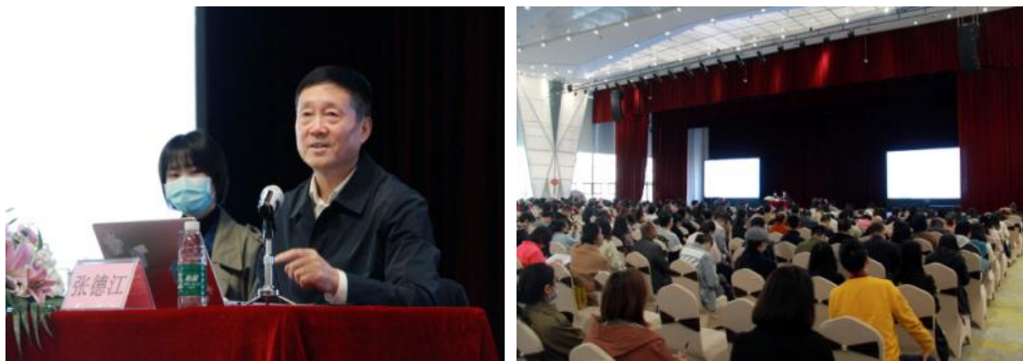
组图2 教育部本科教学评估专家张德江教授莅临我校作专题讲座

四、11月13日，评建工作交流座谈会在梓潼校区文昌学宫四号会议室召开。教育部本科教学评估专家张德江教授、学校校级领导，各职能部门、二级学院负责人围绕评建工作，对立德树人、应用型人才培养、师资队伍建设、学风建设等方面工作展开了深入探讨和交流。