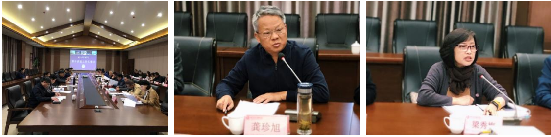
组图 1 2020-2021-1 学期期中评建工作汇报会